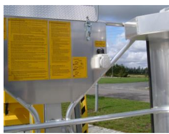
230 V udtag i kurv